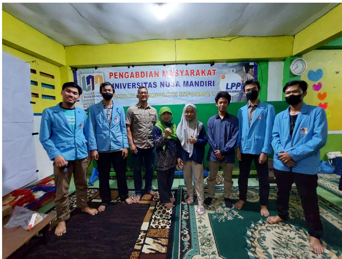
Gambar 3. Perwakilan tim dosen dan mahasiswa yang ikut berpartisipasi dalam kegiatan Pengabdian Masyarakat