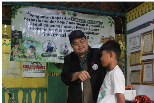
Gambar 3. Sesi Interaktif dengan Peserta

Dinamika proses pendampingan semakin hidup dan partisipatif ketika anak-anak mulai secara terbuka membagikan pengalaman empiris mereka terkait interaksi di dunia maya. Dialog dua arah tercipta saat beberapa peserta secara polos menceritakan pengalaman mereka yang hampir menjadi korban penipuan daring melalui modus pembagian kuota internet gratis di aplikasi pesan singkat. Lebih lanjut, beberapa anak juga mengungkapkan pengalaman traumatis bersinggungan dengan komentar negatif, ujaran kebencian, hingga perundungan siber saat berinteraksi dengan orang asing di game online . Tim pengabdian memanfaatkan momen krusial ini untuk memberikan penguatan psikologis dan membekali mereka dengan strategi koping digital operasional. Anak-anak diedukasi secara mendalam mengenai pentingnya memproteksi privasi data pribadi, menjaga tata krama atau netiquette di ruang digital, serta tata cara memblokir dan melaporkan akun-akun anonim yang melakukan tindakan perundungan.