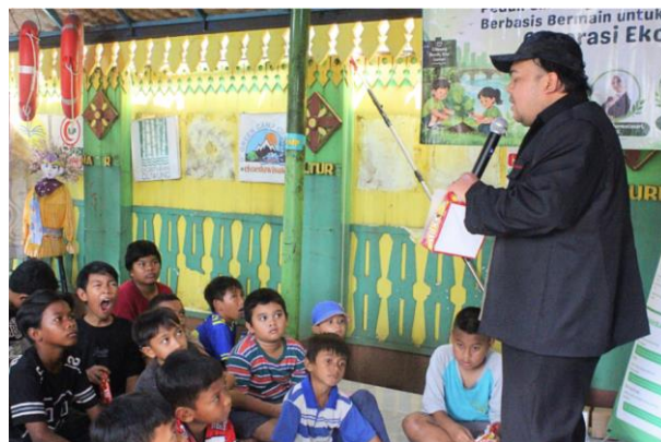
Gambar 2. Pemberian Materi Literasi Media

Kegiatan pengabdian masyarakat yang dilaksanakan pada tanggal 10 Mei 2026 di basecamp Komunitas Mat Peci berlangsung dengan tingkat partisipasi yang tinggi dan dinamika interaksi yang sangat positif dari anak-anak dampingan. Pada tahap awal pelaksanaan, tim pengabdian melakukan observasi partisipatoris untuk memetakan pemahaman dasar peserta terkait penggunaan media digital. Hasil observasi dan wawancara informal awal menunjukkan bahwa mayoritas anak menggunakan gawai secara intensif setiap harinya, terutama untuk mengakses platform permainan daring dan media sosial berbasis video pendek. Mereka cenderung mengonsumsi informasi secara algoritmik dan pasif tanpa memiliki mekanisme filterisasi. Oleh karena itu, proses pendampingan diawali dengan aktivitas ice breaking edukatif yang tidak hanya bertujuan untuk mencairkan suasana, tetapi juga untuk memfokuskan konsentrasi anak-anak sebelum mereka menerima intervensi materi inti mengenai literasi media dasar.